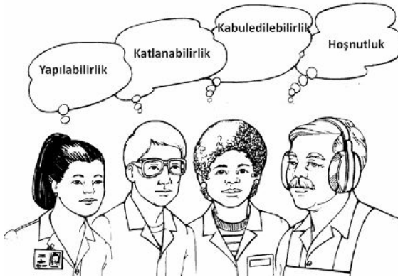
Bir işin ergonomik olmasının şartları